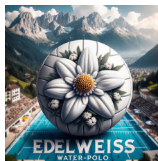
Team Edelweiss Francia