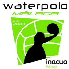
CDW Málaga Andalucía, ES 3 equipos