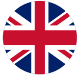
Reino Unido (x3)