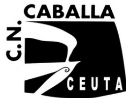
CN Caballa Ceuta, ES 2 equipos